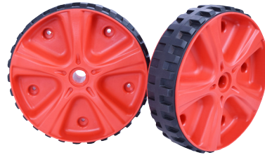
Tires (2) Pneus (2)